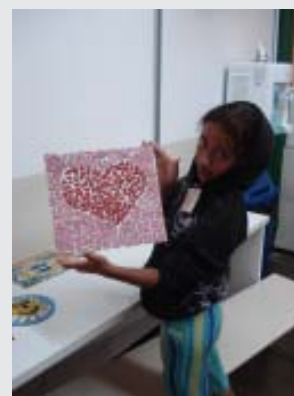
oficinas de expressão em setembro

O Projeto Clicar é um espaço de inclusão social e acesso ao conhecimento e a cultura digital, especialmente criado para crianças e jovens em situação de vulnerabilidade social.