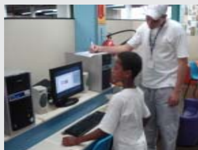
votação simulada para prefeito