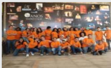
30 jovens participantes do Clicar foram ao Teatro Alfa assistir ao Grupo Corpo. 20/08

Deu-se continuidade as atividades de acompanhamento escolar com objetivo de fortalecer a frequência a escola.