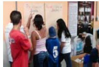
o que é legal na escola