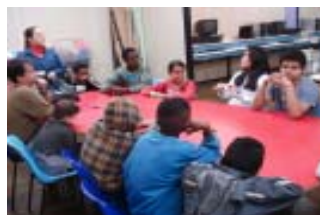
contação de histórias